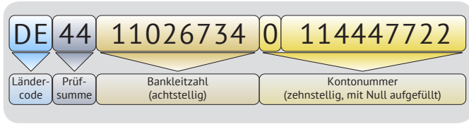
Aufbau der IBAN (International Bank Account Number)

Seit 2014 ist in Deutschland die Verwendung von IBAN und BIC obligatorisch. Deutsche Bankleitzahlen und Kontonummern können seitdem nicht mehr für Transaktionen genutzt werden. Mit SEPA-Transfer sparen Sie sich die Umstellung! Aus Ihren vertrauten Bankdaten wird ganz automatisch die IBAN gemäß Standard-IBAN-Regel errechnet und die dazugehörige BIC ermittelt. SEPA-Transfer kann daher auch als vielseitiger SEPA-Konverter eingesetzt werden.